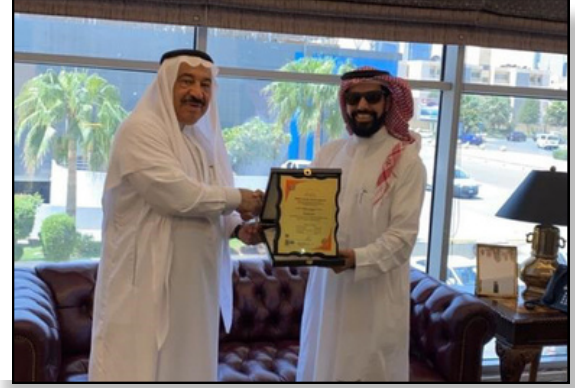
تسليم شهادة ISO 9001:2015 لمؤسسة درع البلاد للحراسات الامنية عام 2020