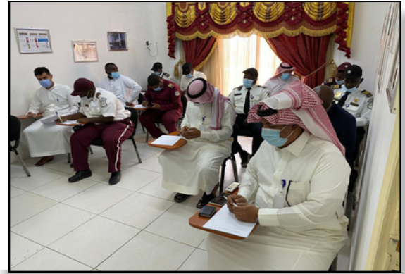
برنامج تدريبي على مواصفة الجودة العالمية لمؤسسة درع البلاد عام 2020