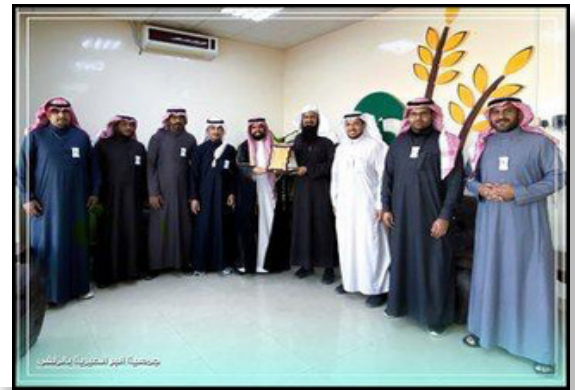
تسليم شهادة ISO 9001:2015 لجمعية البر الخيرية بالزلفي عام 2020