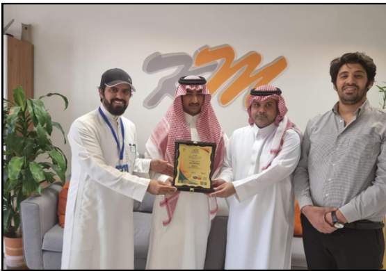
تسليم شهادة الجودة العالمية لنظام السلامة الغذائية ISO 22000:2018 لمصنع قمة المجدل عام 2022