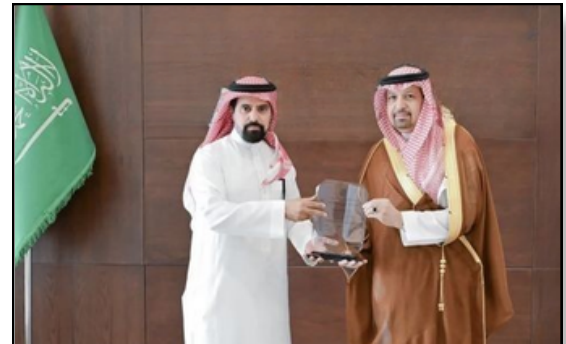
وكيل شركة لكزس وتويوتا في المنطقة الجنوبية عام 2014م