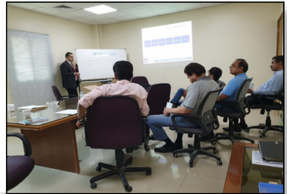
تدريب شركة SELCO على مواصفة الجودة العالمية للبيئة ISO 14001