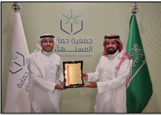
تسليم شهادة ISO 9001-2015 لجمعية حماية المستهلك عام 2022