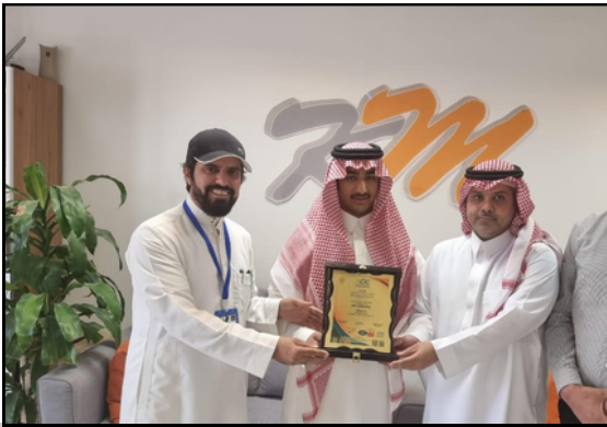
تسليم شهادة الجودة العالمية لنظام السلامة الغذائية 2018- ISO 22000 لمصنع قمة المجدل عام 2022