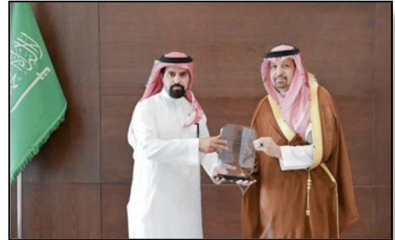
وكيل شركة لكزس وتويوتا في المنطقة الجنوبية عام 2014م