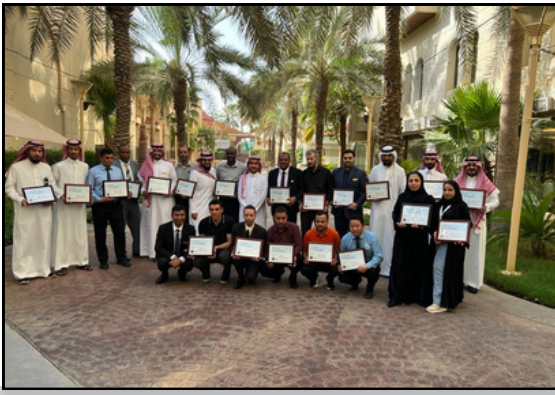
برنامج تدريبي على مواصفات الجودة العالمية & ISO 9001 عام 2022 HACCP & ISO 22000 & ISO 45001 لفندق مداريم كراون مجموعه مداريم كراون Madaramim Crown Hotel