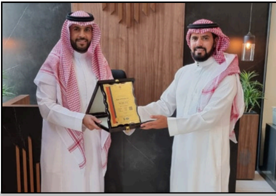
المدير التنفيذي لمستشفى قوى الأمن بوزارة الداخلية يستلم الشهادة عام 2013