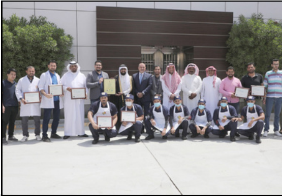
تسليم شهادة الجودة في السلامة الغذائية ISO 22000 لمصنع دار النعائم للحلاوة الطحينية عام 2019