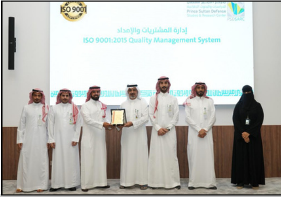
تسليم شهادة ISO 9001 لإدارة المشتريات والإمداد - إدارة العامة للشؤون المالية والخدمات المشتركة في مركز الأمير سلطان للدراسات والبحوث الدفاعية عام 2022