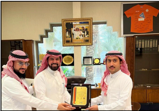
تسليم شهادة ISO 45001-2018 لفندق مداريم كراون عام 2022