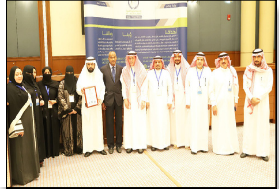
حفل تسليم شهادة الجودة العالمية ISO 9001 للجمعية السعودية الخيرية لمرضى الفصام في فندق الريتز كارلتون بحضور سمو الأميرة / سميرة الفيصل آل سعود حفظها الله ( رئيسة الجمعية عام 2016 )

الجمعية السعودية الخيرية لمرضى الفصام SOCIETY OF MENSA CHARITY ASSOCIATION