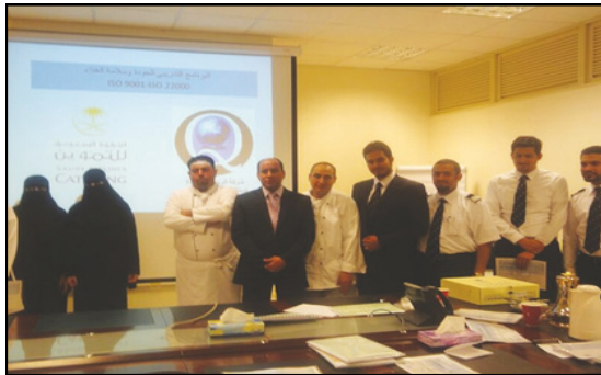
الدورة التدريبية الخاصة بالجودة وسلامة الغذاء لتموين الخطوط السعودية عام 2011