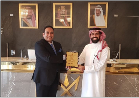
تسليم شهادة HACCP لفندق حياة الرياض عام 2020