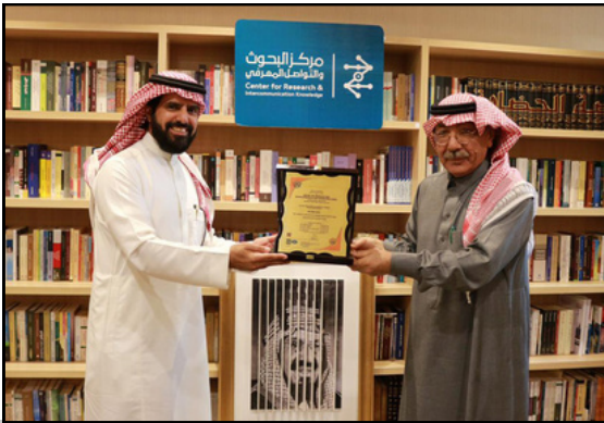
تسليم شهادة الجودة العالمية ISO 9001 لمركز البحوث والتواصل المعرفي