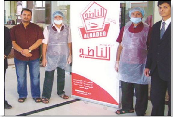
فريق الجودة مع طاقم الطهي بمطاعم الناتج عام 2008م