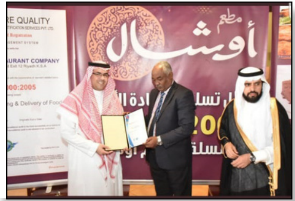
ISO تسليم شهادة الجودة العالمية لسلامة الغذاء 22000 لمطاعم أوشال عام 2020