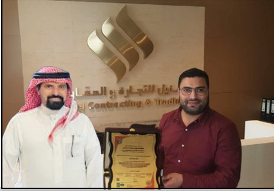
تسليم شهادات الجودة العالمية ايزو ISO لشركة سنيل للمقاولات عام 2020 م