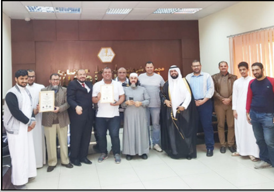
مجموعة وادي النحل للعسل والعود تتسلم شهادة الجودة العالمية في سلامة الغذاء ISO 22000 عام 2019 وادي النحل