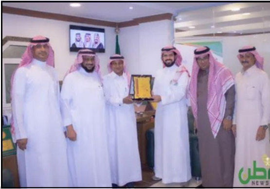
تسليم شهادة الجودة العالمية ISO 9001 لجمعية البر الخيرية بالطوال عام 2021م