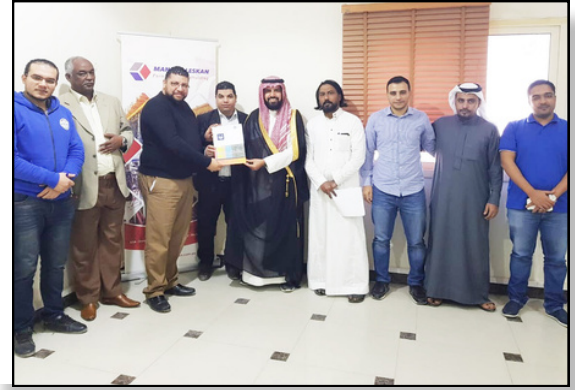
شركة منار العمران بالدمام تتسلم شهادة الجودة العالمية ISO 9001 عام 2014