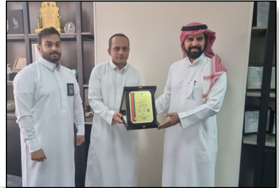
تسليم شهادة الجودة العالمية ISO 9001 لشركة دار المركبة عام 2022م