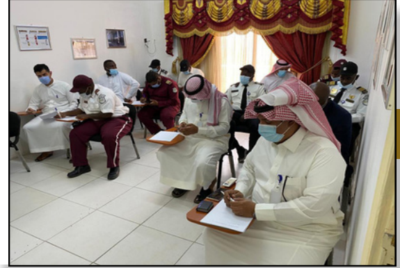
ISO 9001 برنامج تدريبي على مواصفة الجودة العالمية لمؤسسة درع البلاد عام 2020