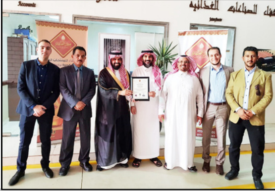
حفل تسليم شهادة الجودة العالمية iso 22000 للسلامة الغذائية لمصنع سدر الشفاء للعسل عام 2019