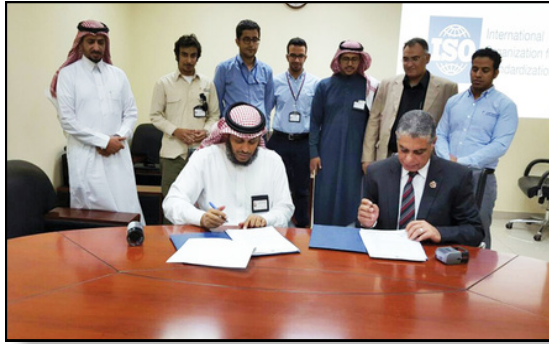
توقيع عقد قسم الطوارئ بالشركة السعودية للكهرباء عام 2013