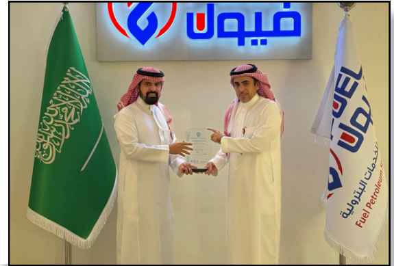
تم تسليم شهادات ثلاث مواصفات +ISO 14001 + ISO 9001 ISO 45001 لشركة فيول للخدمات البترولية عام 2025